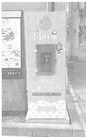
設置された「宮の泉」

Rするための給水スポットで、マイボトルに給水することで熱中症対策や環境配慮にも役立つ。最初に設置されたライトキ