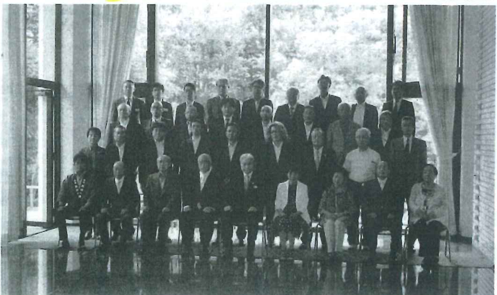
式典後、出席者で記念撮影

建設関係の主な寄付者と寄付内容は、県建設業協会（宇都宮市）が現金と防護服一式100着、県冷凍空調工業会冷凍空調設備部会（宇都宮市）が大会練習用資材、宇都宮市管工事業協同組合（宇都宮市）が配管材料一式、猪股建設（大田原市）がドローン一式とタブレット1台、フケ々都市開発（宇都宮市）が現金、協同組合無垢の会（日光市）が足踏み式消毒台（木製）10基、県建設業暴力追放推進協議会安蘇支部（佐野市）が現