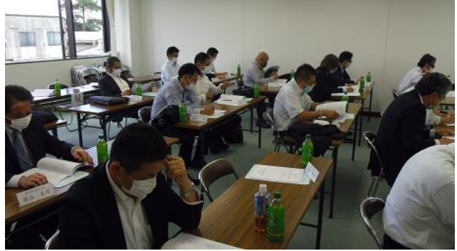
議案を審議する組合員