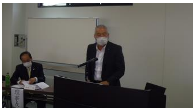
小牧副理事長による開会の言葉

なお、その後に開催された理事会において、「理事長、副理事長及び専務理事」が選出され、出席組合員の前で別紙の通り「新役員」が紹介されました。